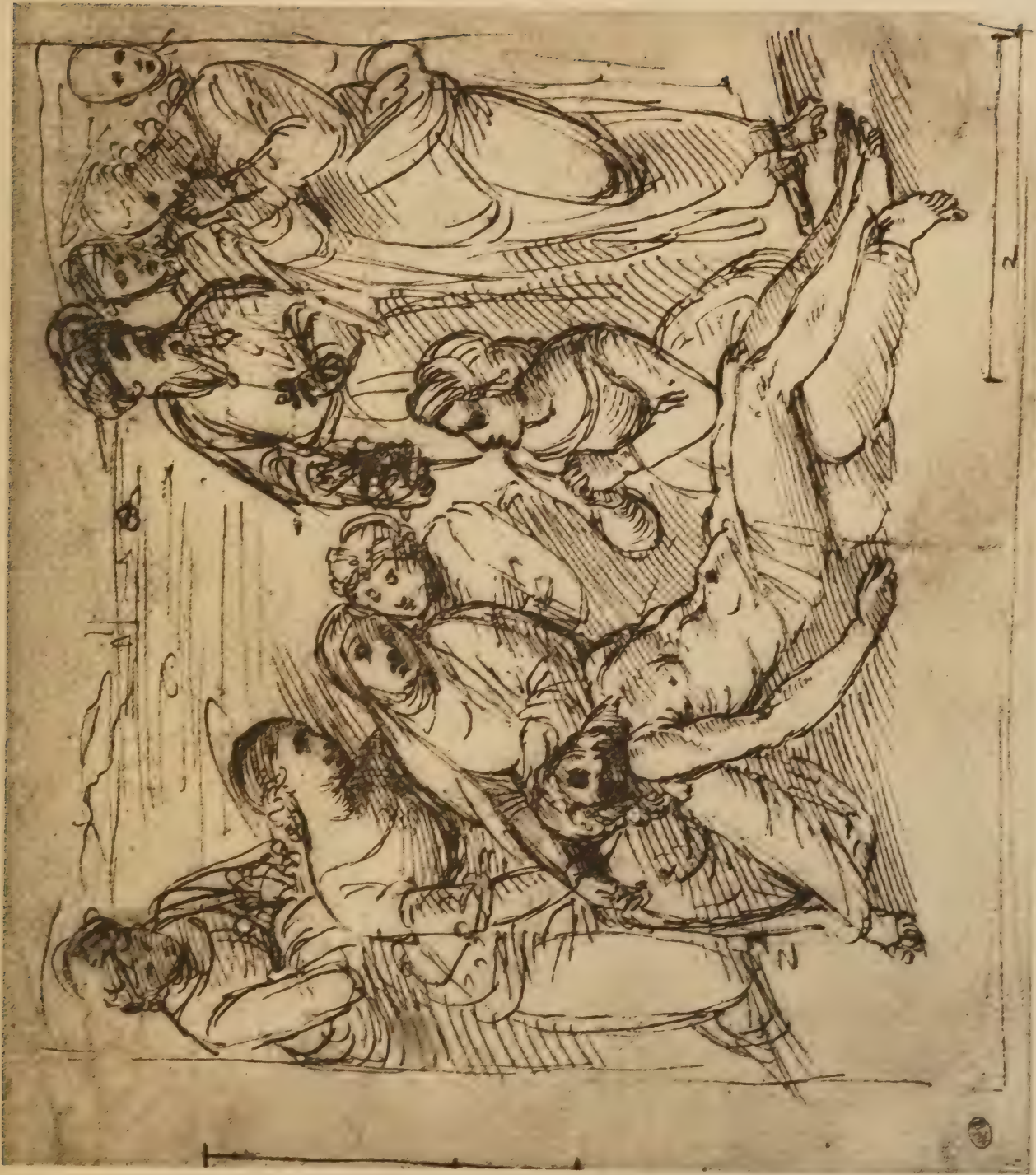
Dessin pour la Déposition (Galerie Borghèse)